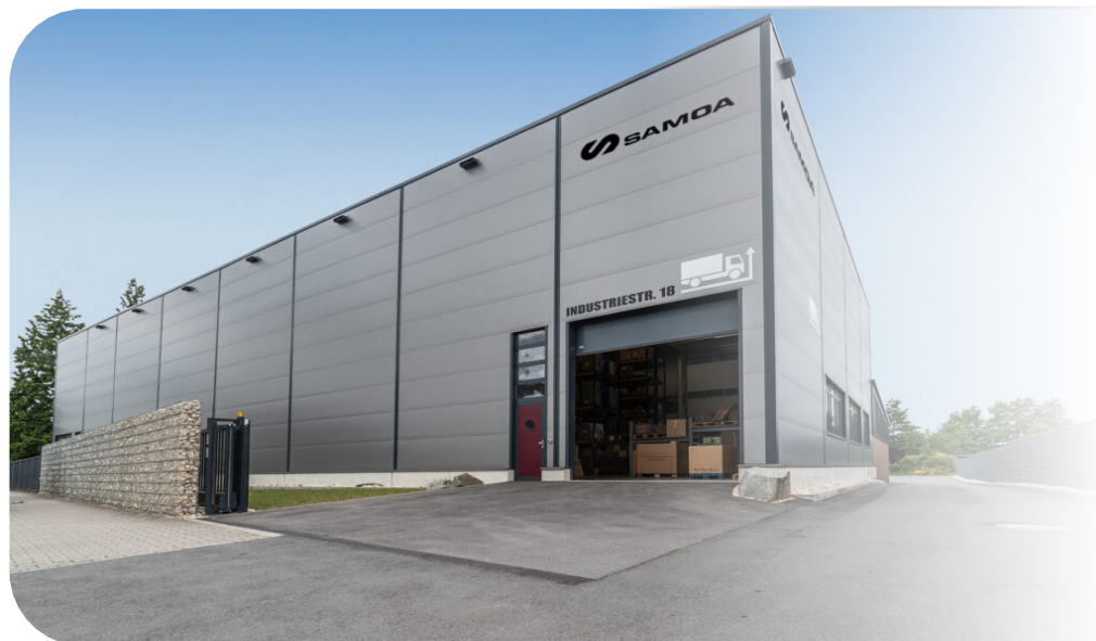
Logistikhalle der SAMOA GmbH in Deutschland, Viernheim

Für SAMOA Deutschland sind neben Produktqualität und Kundenzufriedenheit auch Mitarbeiter und soziales Engagement von hoher Wichtigkeit. So zeichnet sich das Unternehmen durch gemeinnütziges Engagement aus, was sich durch die Unterstützung der Lebenshilfe, des Deutschen Blindenhilfswerk, der Caritas, des Deutschen Roten Kreuzes Kreis Bergstraße und der Freiwilligen Feuerwehr Viernheim zeigt.