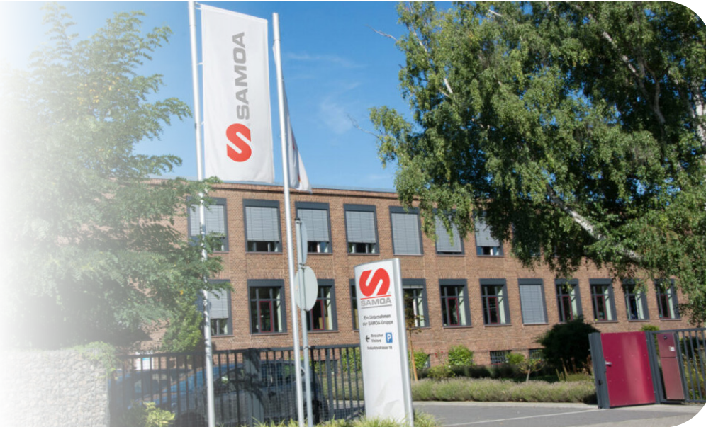
Headoffice der SAMOA GmbH in Deutschland, Viernheim

Durch den Zusammenschluss von HALLBAUER, mit über 100 Jahren Erfahrung, mit der SAMOA Industrial S.A., gegründet 1958 mit Sitz in Gijón (Spanien), wurde der Grundstein für einen umfassenden Service und ein vielfältiges Produktprogramm gelegt.